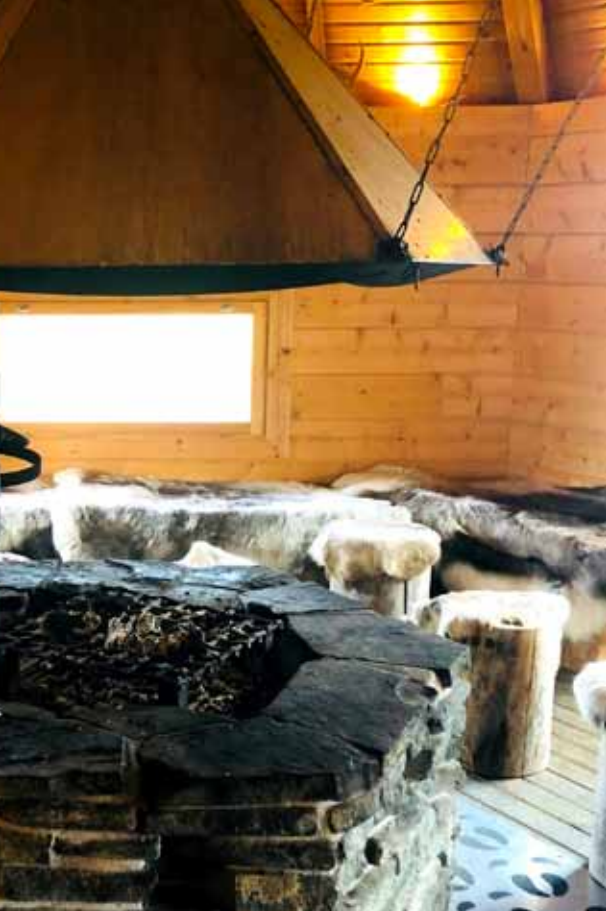
POSEZENÍ V TRADIČNÍ KOTĚ PATŘÍ K NEODMYSLITELNÝM FINSKÝM ZÁŽITKŮM